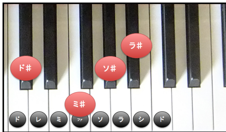
#(シャープ)とピアノ鍵盤の関係