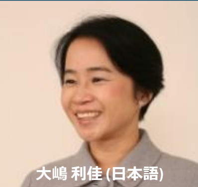
大嶋 利佳 (日本語)

ロリー・バーデン氏は、著作家、コンサルタント、自己鍛錬家であります。彼の著書「Take the Stairs」は、ウォールストリート・ジャーナルとニューヨークタイムズに於いてNo. 1とNo. 2ベストセラーに成り、日本語を含めて11の言語に翻訳されています。スピーカとしても、2007年度TMIの世界大会で第2位に輝きました。