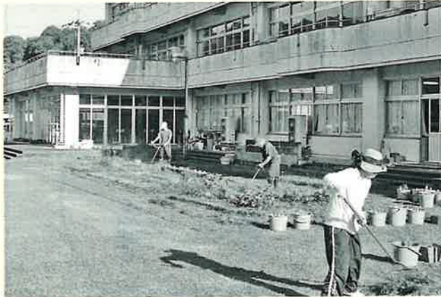
小学校除草作業（地域振興部）