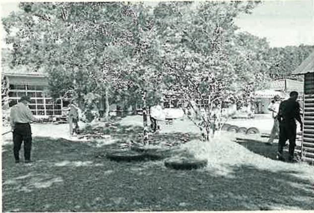
幼稚園園庭除草作業（総務部）