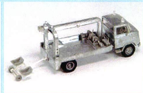
【LV-75a 日産C80型 3.5tトラック レッカー車(厚木自動車販売)】

シリーズ初となる中型トラック、日産C80型を、レッカー車仕様でモデル化しました。実車は1966年にデビュー、'70年代初頭まで生産されていました。通常のレッカー車より大型で、当時は2トントラック程の大きさのクルマを牽引していたようです。もちろん、製品でも牽引用の台車を再現、乗用車や小型トラックのミニチュアカーを載せて楽しめます。ボディカラーはグレー系で、実車取材をさせていただいた(株)厚木自動車販売様の屋号を印刷で入れました。