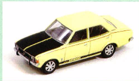
【LV-45c 三菱コルトギャランA11GS(黄)】

1964年に登場した日野コンテッサ1300はLV-09a/bとして製品化し、ご好評をいただきました。今回はクーペと共通のエンジンを載せたスポーツセダン『1300S』の仕様をタンボ印刷等で再現、当時のミニチュアカーで見られたグリーンボディとしました。