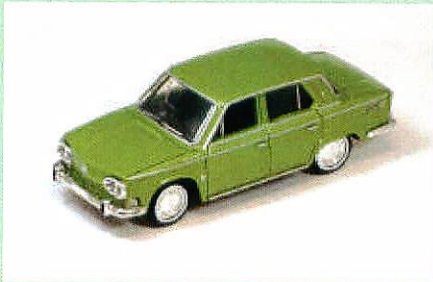
【LV-09c 日野コンテッサ1300S(緑)】

1964年に登場した日野コンテッサ1300はLV-09a/bとして製品化し、ご好評をいただきました。今回はクーペと共通のエンジンを載せたスポーツセダン『1300S』の仕様をタンボ印刷等で再現、当時のミニチュアカーで見られたグリーンボディとしました。