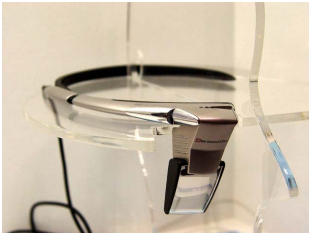
図2. 島津製作所より最新の HMD DATA GLASS3/A 2007年5月11日発売

http://pc.watch.impress.co.jp/docs/2003/0625/ivr06.jpg