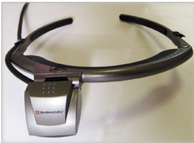
図1.HMDの一例（2007年8月 九十九電機 秋葉原店にて撮影 SHIMADZU DATA GLASS2より）