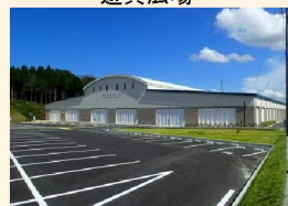
多目的グラウンド