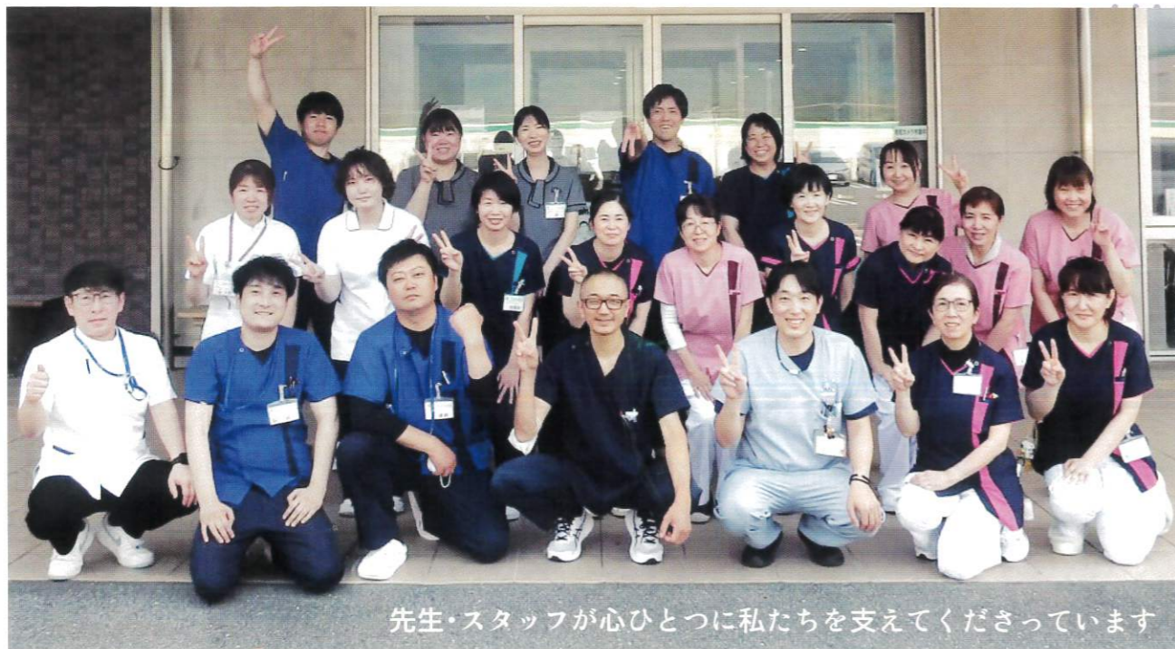
先生・スタッフが心ひとつに私たちを支えてくださっています

患者の生活を見守り、その人の人生に最期まで寄り添う医療を念頭に日夜ご尽力されています。