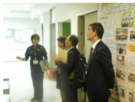
施設担当者から説明をうける議員団

ごみ減量で成果を上げている「葛飾区リサイクルセンター」の現場を視察しました。事業はシルバー人材センターに委託、粗大ゴミ集積は、民間施設2か所に設置し、毎日4回収、修理や磨きをかけ、販売できる製品にします。それらを販売拠点である「エコプラザ」に一日2回搬入。また、無償の物品を展示し、希望者に提供しています。 粗大ごみの物品は、タンス、机・テーブル・椅子・など。電気製品は扱っていません。扱った品数9863件、無料引渡し2379件、有償7232件、売れ残り252件です。リサイクル総量は重量に換算すると、123トンにもなります。