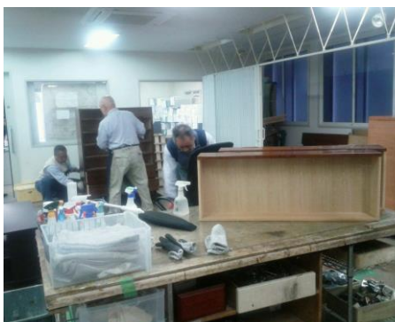
搬入された家具などを職員が直している

福岡県大牟田市「地域認知症ケアコミュニティ推進事業」座学と「高齢者総合ケアセンター」を視察しました。大牟田市は現在12万人の人口。高齢者数は4万人を超え、高齢化率は33.4%で、毎年1%ずつ増え2020年がピークになると推計しています。 「地域認知症ケアコミュニティ推進事業」は、「介護保険制度は、安心で満足のいくサービスを利用できなければ、だれもが保険料負担に理解を示すはずがない」この考えを基本として協議会が設置されました。認知症の人を地域全体で支え、認知症になっても、誰もが住み慣れた家や地域で、安心して豊かに暮らし続ける、そのためにいろいろ取り組みがされています。その中