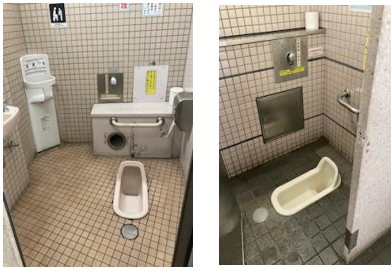
久喜駅東口・西口女子トイレ

答 西口の故障箇所が洋式化されるのであれば、東口の一カ所も変えるべきだ。今後検討して参りたい。