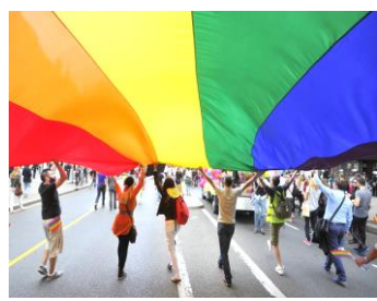
性的少数者に人権を！レインボーの大幕を掲げる集会の参加者みなさん

問 性的少数者と言われるが、人口比で3.3%という数字もある。市内で4000名の方が、ともに暮らしていることになる。今こそ、各種の講演会や集い、啓発事業などを市として期間を設定して集中的の取り組んでどうか。世界では、6月を「プライド月間」として各種のイベントに取り組んでいるが。