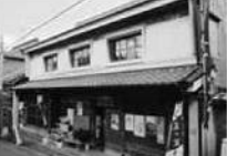
③いこいの駅 藍の家

築100年以上にもなる、元染物屋です。現在ではギャラリー等として活用されているほか、地域の情報の発信源となっています。