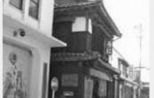
②うにの駅 上田清商店

ウニを専門に販売しています。玄界灘で育まれたウニは、質・味ともに高い評価を得ています。