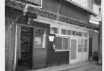
④組み木の駅 夢会館

組み木の工房兼ギャラリーです。いきいきと老後を楽しむ場にもなっています。とてもかわいい組み木がたくさんあります。